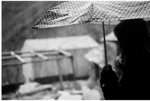
- Coruña, Septiembre de 2014 -